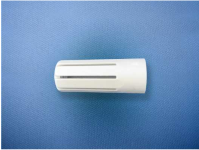
Fig. 1 – Polyamide tip