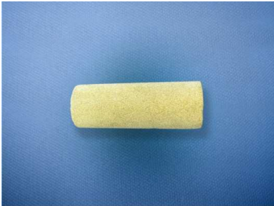
Fig. 3 – Sintered bronze tip